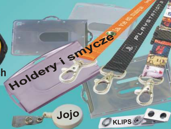
Holdery i smycze