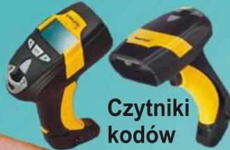
Czytniki kodów kreskowych

Oferujemy czytniki do obsługi kart z takimi nośnikami jak: pasek magnetyczny HICO i LOCO, chip Mifare, Unique, HID, Q5, SLE 4428, SLE 5528, kody kreskowe standard i 2D. Do przechowywania i zabezpieczania kart i identyfikatorów proponujemy klipsy, zapinki, jojo i holdery ze smyczami z indywidualnym nadrukiem logotypu klienta.